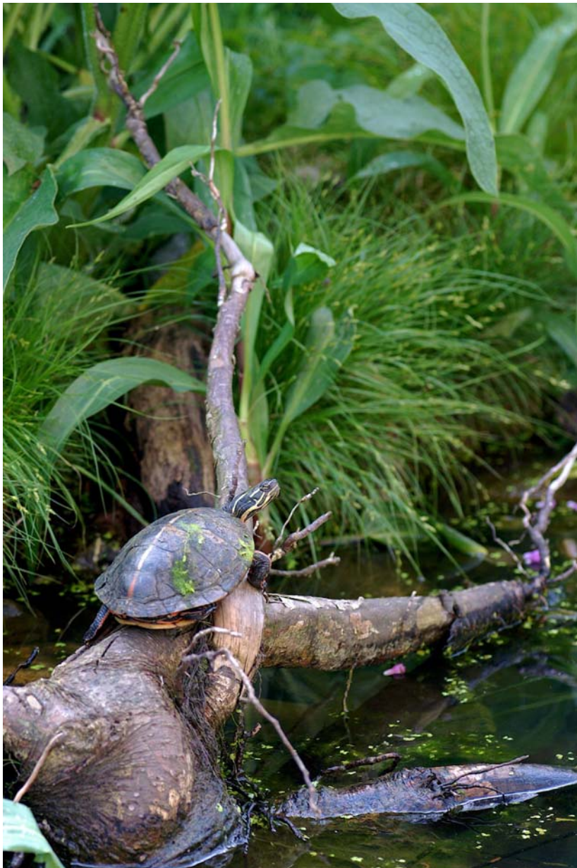
Abb. 1: Südliche Zierschildkröte Chrysemys picta dorsalis .