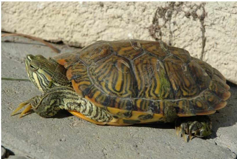
Abb. 6: Cumberland-Schmuckschildkröte Trachemys scripta troosti .