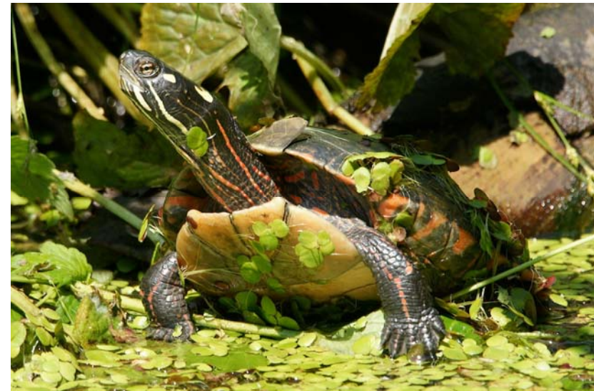
Abb. 2: Östliche Zierschildkröte Chrysemys picta picta .