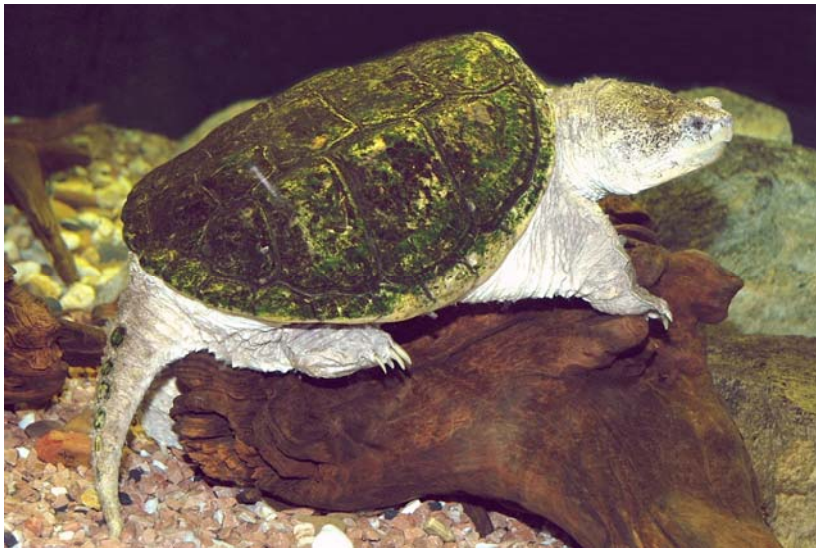
Abb. 4: Schnappschildkröte Chelydra serpentina .