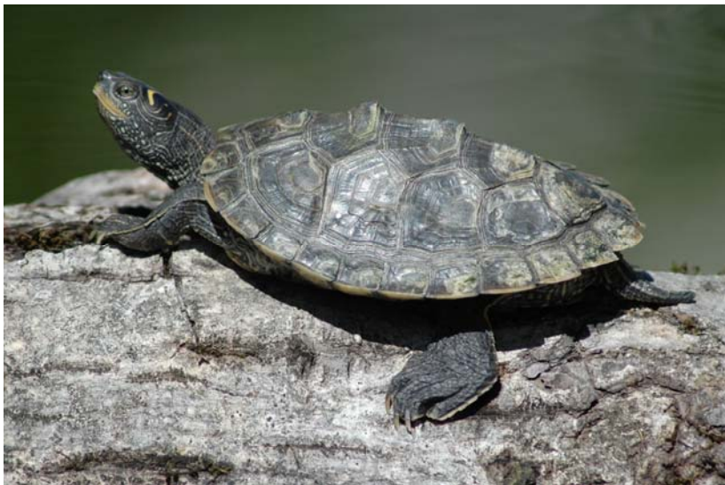
Abb. 18: Falsche Landkartenhöckerschildkröte Graptemys pseudogeographica pseudogeographica .