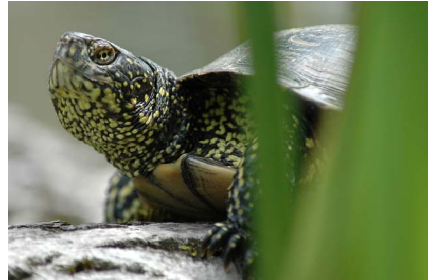
Abb. 21: Europäische Sumpfschildkröte Emys orbicularis orbicularis .

Anhand der Ergebnisse der Freilanduntersuchungen ist davon auszugehen, dass die dort gesichteten Arten in der Lage sind, unter den Klimabedingungen wärmebegünstigter Regionen Österreichs im Freiland zumindest einen Winter zu überleben. Unter den gesichteten Arten befanden sich neben Trachemys scripta scripta und Trachemys scripta elegans , welche bereits bei der Interpretation der Ergebnisse der Befragung von Schildkrötenhaltern und dem Vergleich bioklimatischer Faktoren besprochen wurden, auch Vertreter der Gattung Pseudemys . Da Arten der Gattung Pseudemys , vor allem Pseudemys concinna ssp. und Pseudemys nelsoni häufig im Handel angeboten werden, ist davon auszugehen, dass diese auch zukünftig in den Gewässern Österreichs ausgesetzt werden. Die Überlebens- und Reproduktionsfähigkeit dieser Arten unter den Klimabedingungen wärmebegünstigter Regionen Österreichs ist jedoch als gering einzuschätzen,