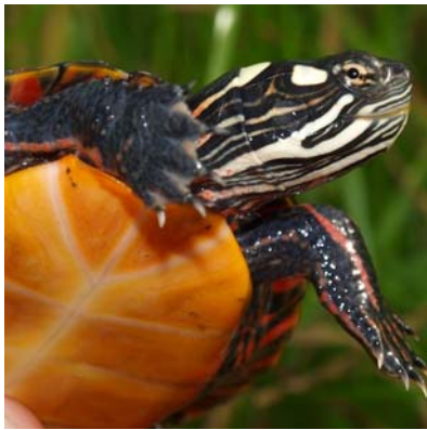
Abb. 9: Chrysemys picta picta (Abb) konnte genau wie Trachemys scripta elegans in Österreich bereits im Freiland reproduzieren.

konnten ( Mauremys japonica und Trachemys scripta elegans ), ist als geringer einzuschätzen, da diese unter grossklimatisch günstigeren Bedingungen erfolgten und/oder sich die Freilandanlagen in mikroklimatisch begünstigten Lagen befanden.