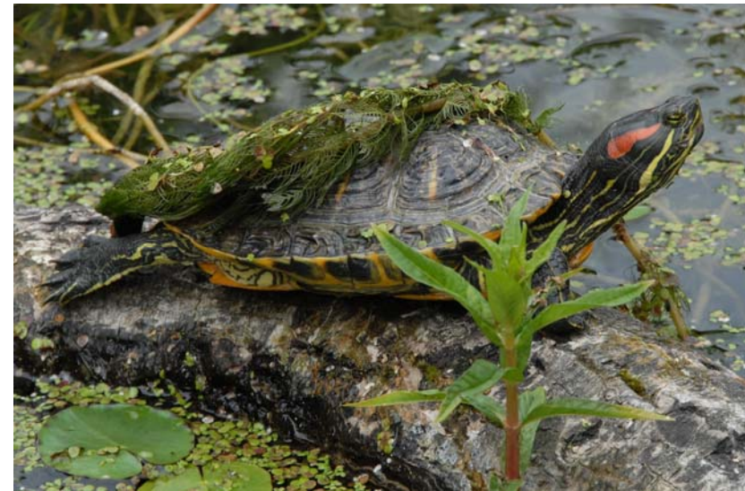
Abb. 10: Rotwangenschmuckschildkröte Trachemys scripta elegans .

Bei den Freilanduntersuchungen konnten insgesamt 67 Wasserschildkröten beobachtet werden. Bei 73 % der gesichteten Tiere handelte es sich um Trachemys