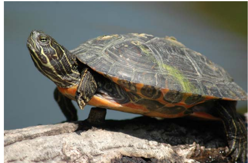
Abb. 7: Hieroglyphen-Schmuckschildkröte Pseudemys concinna concinna .