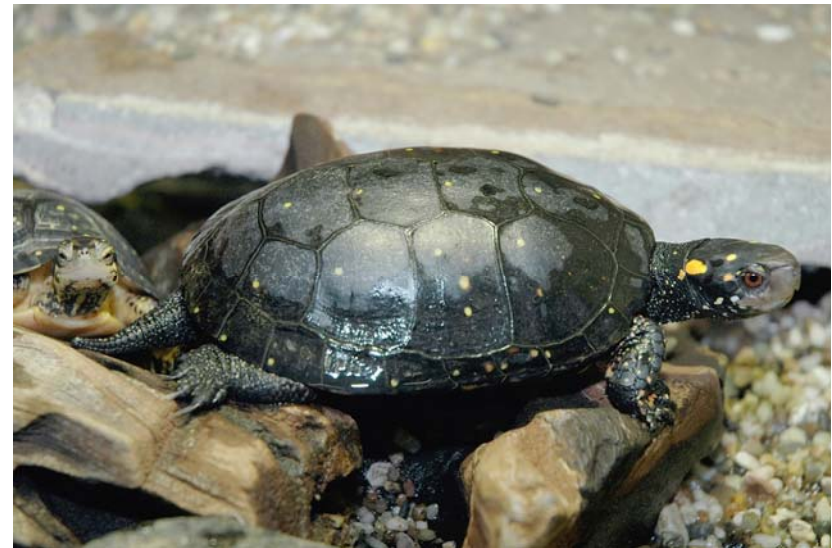
Abb. 19: Tropfenschildkröte Clemmys guttata .