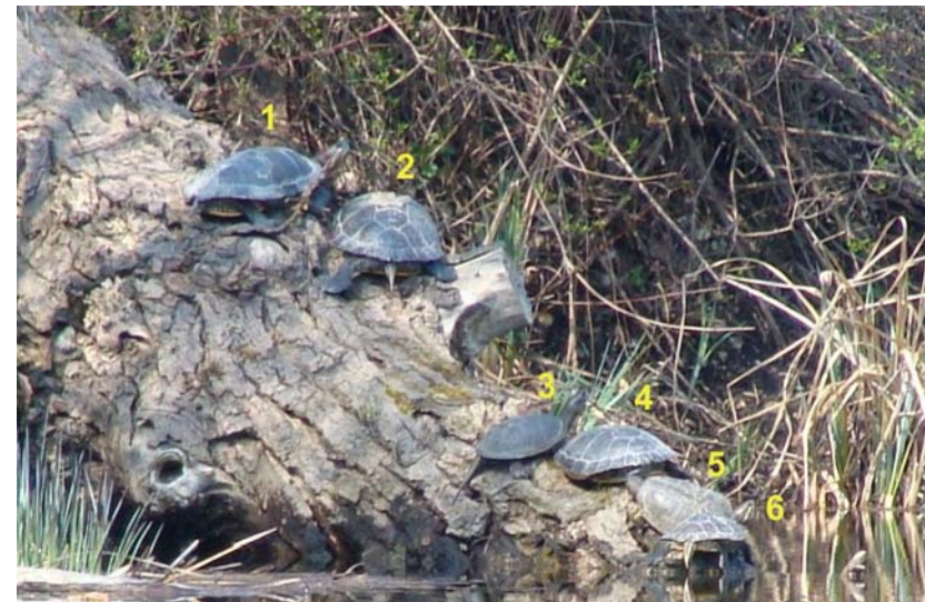
Abb. 11: Trachemys scripta elegans (1, 2, 4, 6) und Emys orbicularis ssp. (3, 5) im Untersuchungsgebiet.