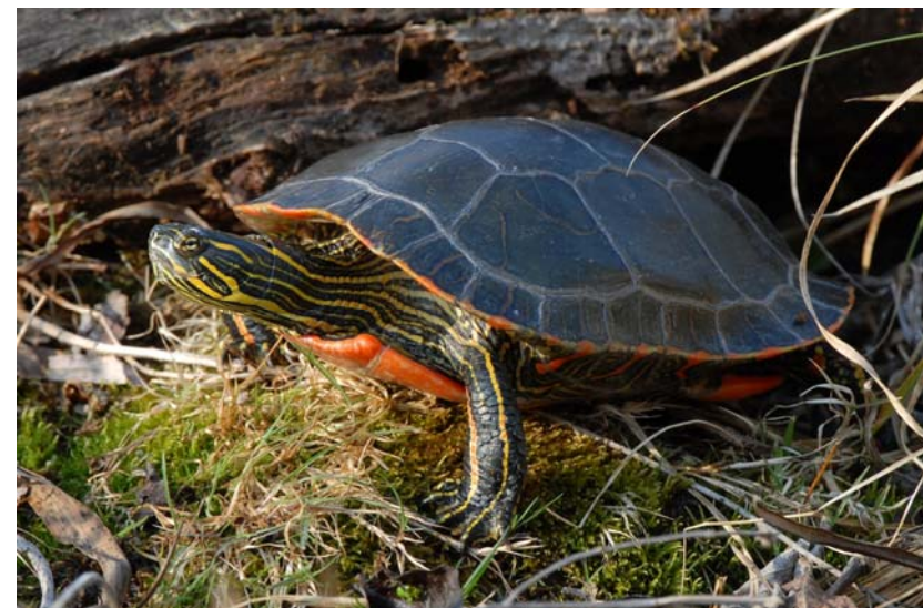
Abb. 3: Westliche Zierschildkröte Chrysemys picta bellii .