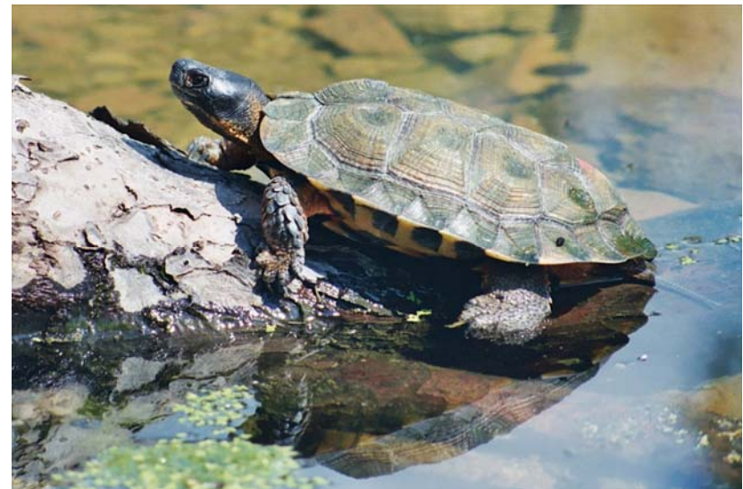
Abb. 20: Waldbachschildkröte Glyptemys insulpta .