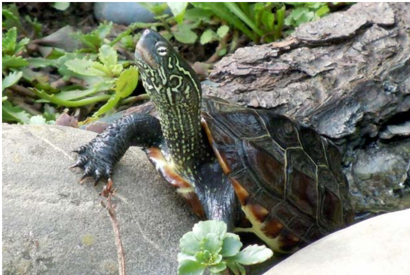
Abb. 13: Chinesische Dreikielschildkröte Mauremys reevesii .