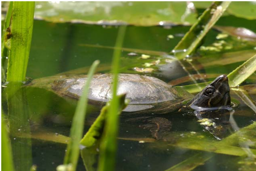
Abb. 17: Gewöhnliche Moschusschildkröte Sternotherus odoratus .