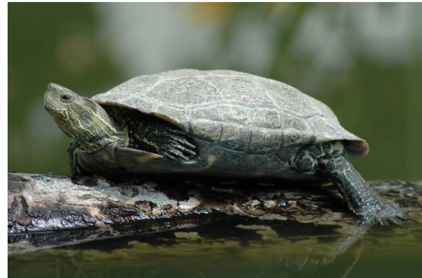
Abb. 15: Ostmediterrane Bachschildkröte Mauremys rivulata .