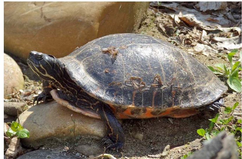
Abb. 8: Nördliche Rotbauch-Schmuckschildkröte Pseudemys rubriventris .