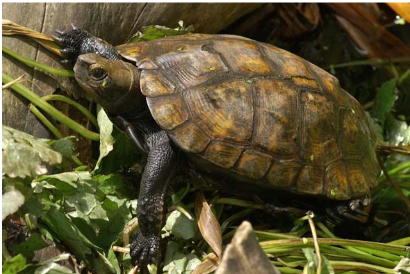
Abb. 14: Japanische Sumpfschildkröte Mauremys japonica .