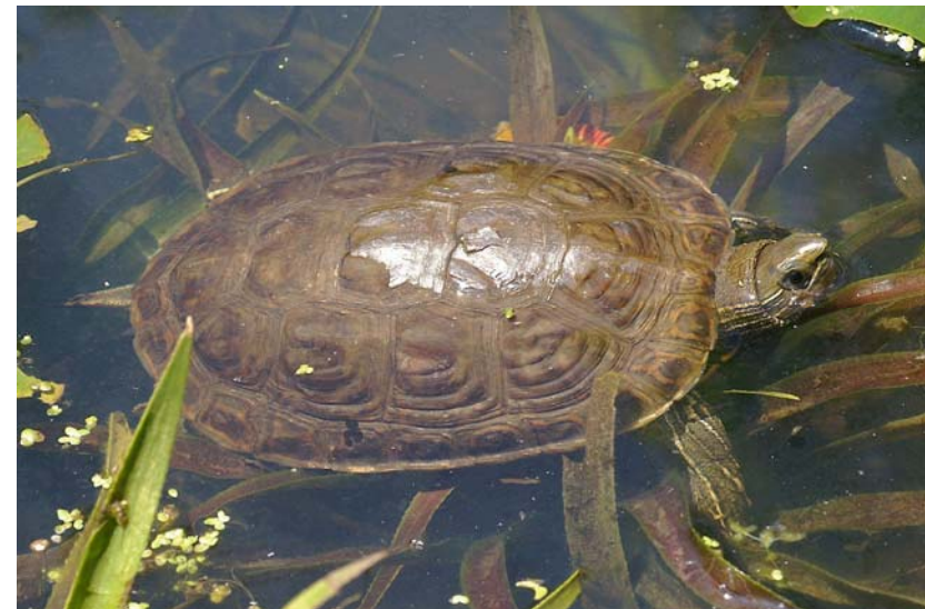
Abb. 16: Kaspische Bachschildkröte Mauremys caspica .