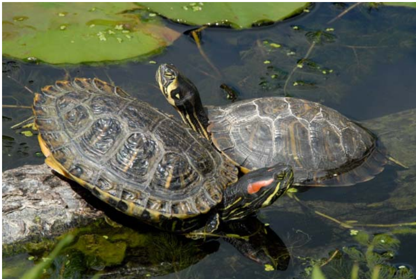
Abb. 5: Gelbwangenwangenschmuckschildkröte Trachemys scripta scripta (rechts) und Rotwangenschmuckschildkröte Trachemys scripta elegans (links).