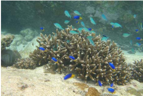
Abb. 4a: Fische in der Bucht von Anse Lazio: Pomacentrus caeruleus und Chromis viridis über einer Geweihkoralle Acropora sp. (2007).