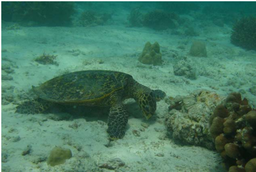
Abb. 5d: Echte Karettschildkröten Eretmochelys imbricata in der Bucht von Anse Lazio: Halbwüchsiges Tier beim Fressen von Korallen.

auf dem hohen Anteil an abgestorbenen Korallen) bzw. im Zeitraum von 2008 bis 2010 verantwortlich sind (BROWN 2000; BROWN et al. 1996; BRUNO et al. 2007; DOUGLAS 2003; McCLANAHAN 2000). Insbesondere der Sommer 2010 erwies sich seinerzeit als extrem warm ( > 31\text{ }^{\circ}\text{C} Lufttemperatur) und regenarm, was zu einer erneuten Schädigung des Korallenbestandes in der Anse Lazio führte.