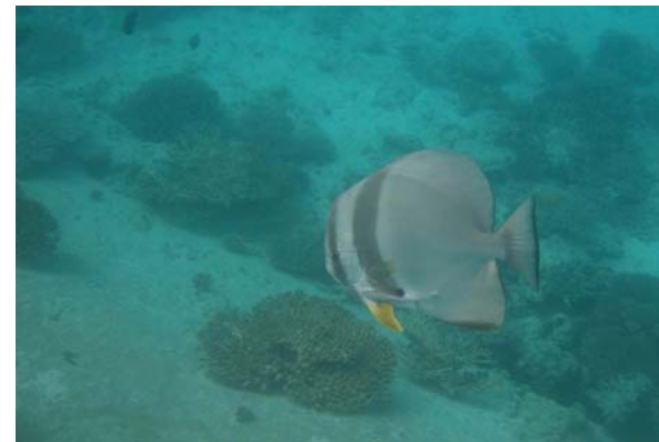
Abb. 4f: Fische in der Bucht von Anse Lazio: Platax teira (2008).