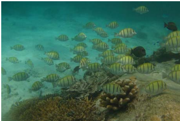
Abb. 4b: Fische in der Bucht von Anse Lazio: Schwarm von Acanthurus triostegus (2008).