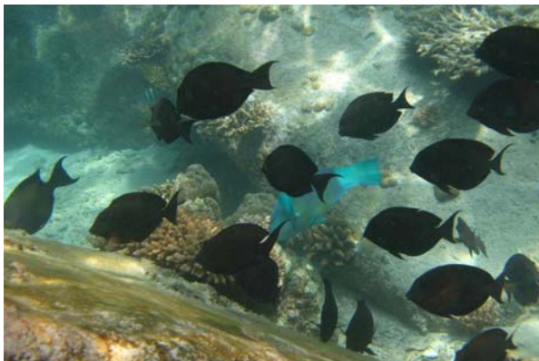
Abb. 4c: Fische in der Bucht von Anse Lazio: Schwarm von Ctenochaetus striatus (2008).