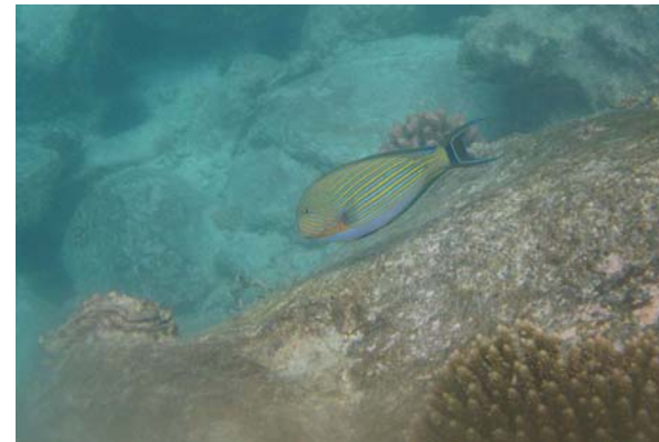
Abb. 4e: Fische in der Bucht von Anse Lazio: Acanthurus lineatus (2007).