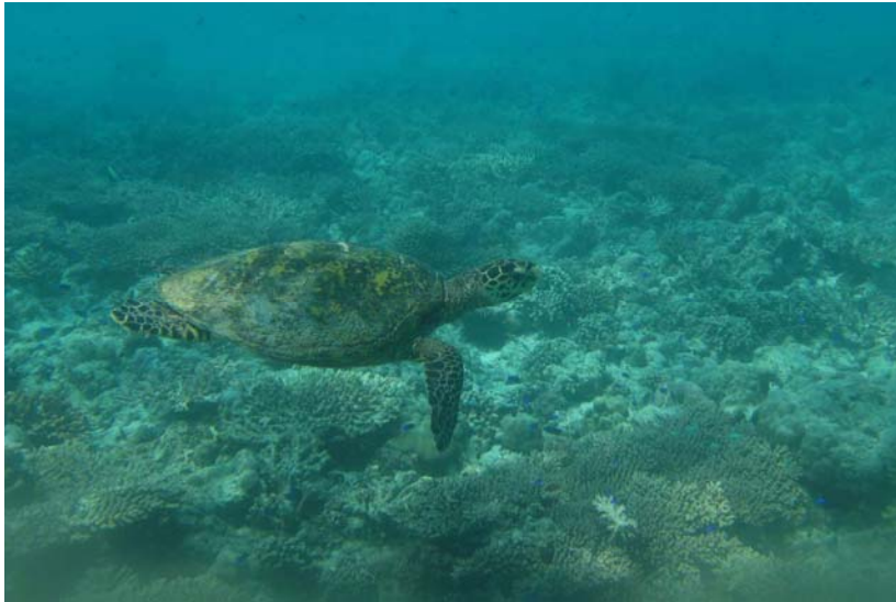
Abb. 5c: Echte Karettschildkröten Eretmochelys imbricata in der Bucht von Anse Lazio: Weibchen freischwimmend über den regenerierenden Korallenbeständen (2008).