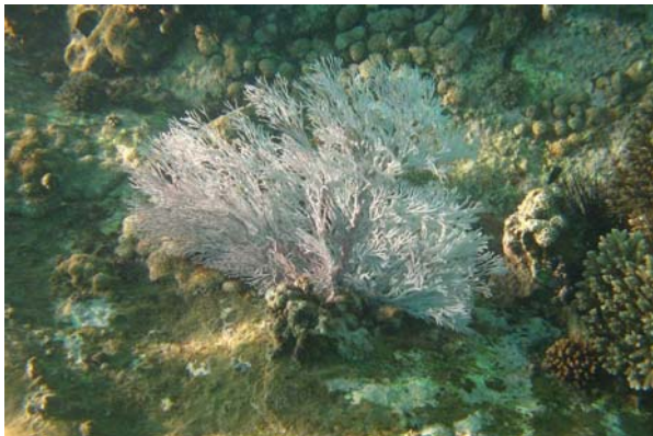
Abb. 3b: Korallen in der Bucht von Anse Lazio: lebende Hornkoralle Gorgonidae (2008).