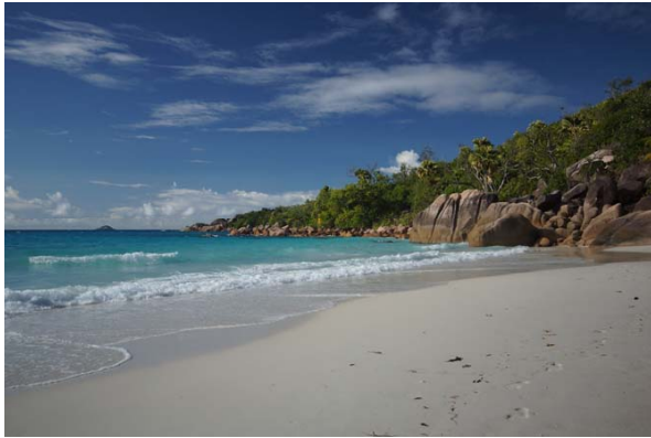
Abb. 1a: Die Bucht von Anse Lazio mit Granitfelsen und Korallenstrand an der Ostseite.