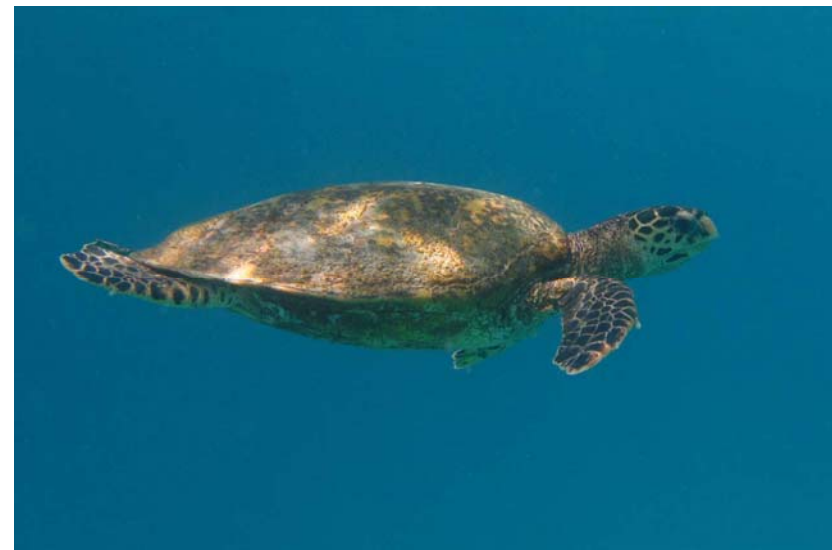
Abb. 5b: Echte Karettschildkröten Eretmochelys imbricata in der Bucht von Anse Lazio: Halbwüchsiges Exemplar im Freiwasser (2008).