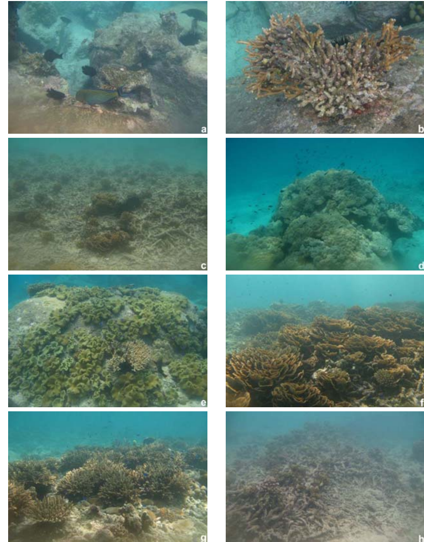
Abb. 2: Übersicht der Korallenbestände im Laufe der untersuchten Jahre: a) unbesiedelte Felsabschnitte im Uferbereich (2007); b) Stark geschädigte Geweihkoralle Acropora sp. auf einem Granitfelsen (2007); c) beginnende Rekolonialisierung abgestorbener Korallenareale (2007); d) dicht mit Porenkorallen Porites sp. besiedelter Fels (2008); e) mit Lederkorallen Sarcophyton sp. bewachsener Fels (2008); f) Gruppe von Kelchkorallen Turbinaria sp. (2008); g) Gruppe von Geweihkorallen Acropora sp. (Bildmitte) und Pilzkorallen Fungia sp. (Vordergrund) (2008); h) Abgestorbene Geweihkorallen Acropora sp. (2010).