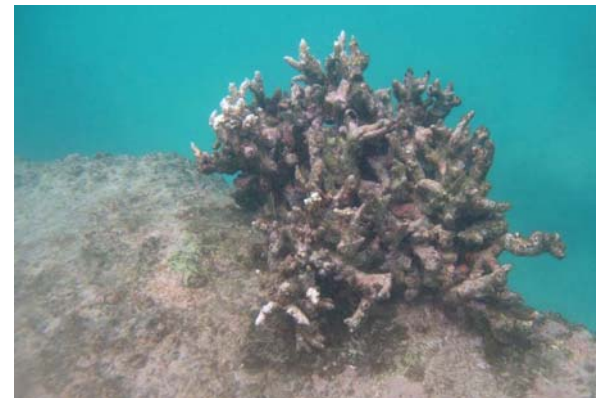
Abb. 3f: Korallen in der Bucht von Anse Lazio: abgestorbene Geweih- koralle Acropora sp. (2010).