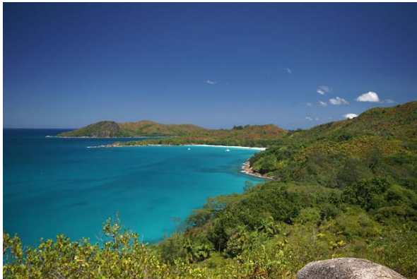
Abb. 1b: Die Bucht von Anse Lazio im Überblick (Bildmitte).