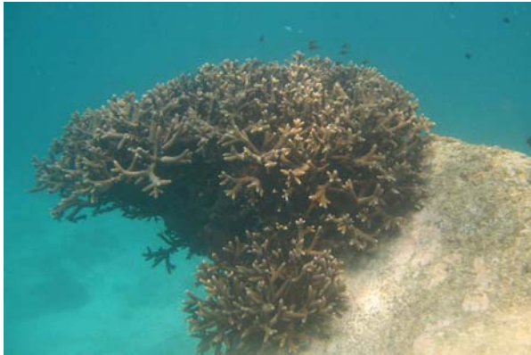
Abb. 3a: Korallen in der Bucht von Anse Lazio: lebende Geweihkoralle Acropora sp. (2009).