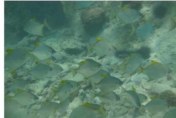
Abb. 4d: Fische in der Bucht von Anse Lazio: Schwarm von Mondactylus argenteus (2008).