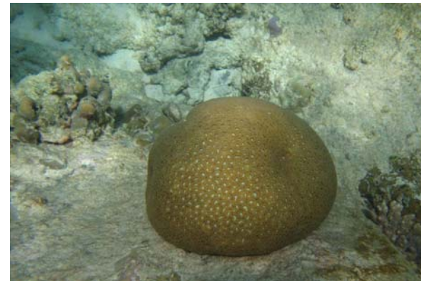
Abb. 3e: Korallen in der Bucht von Anse Lazio: lebende Sternkoralle Favia sp. (2008).