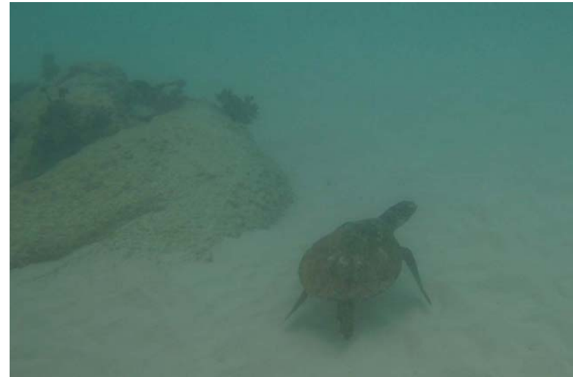
Abb. 5a: Echte Karettschildkröten Eretmochelys imbricata in der Bucht von Anse Lazio: Scheues Exemplar am Grund der Bucht (2007).

Leider sind die Korallenbestände der inneren Seychellen oftmals bereits sehr stark geschädigt, was bereits Mitte/Ende der 90iger Jahre seinen Ursprung hat (SPENCER et al. 2000). Wenngleich die Ursachen hierfür möglicherweise vielfältig sind, zeigt sich dennoch, dass hier vornehmlich erhöhte Wassertemperaturen für das nachhaltige Absterben der Korallen vor 2007 (basierend