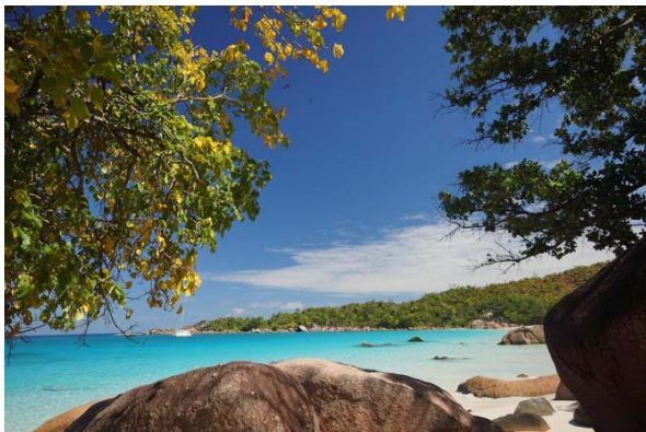
Abb. 1c: Die Nordostspitze der Bucht von Anse Lazio.