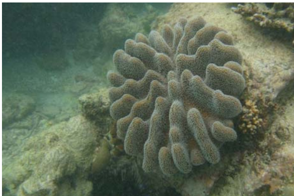
Abb. 3c: Korallen in der Bucht von Anse Lazio: lebende Lederkoralle Sarcophyton sp. (2007).