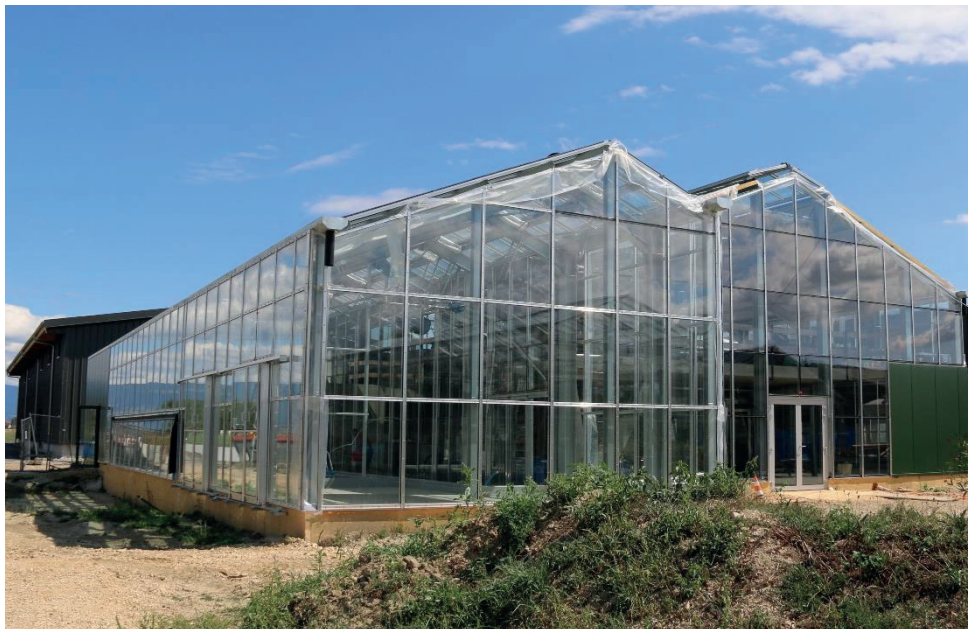
Die neuen, fast fertiggestellten Glasgewächshäuser im August 2018.

54 Becken und 25 Isolierbehälter mit automatischer Wasserzubereitungsanlage wurden im ersten Stock für die 45 verschiedenen Arten von asiatischen und seltenen Schildkröten installiert.