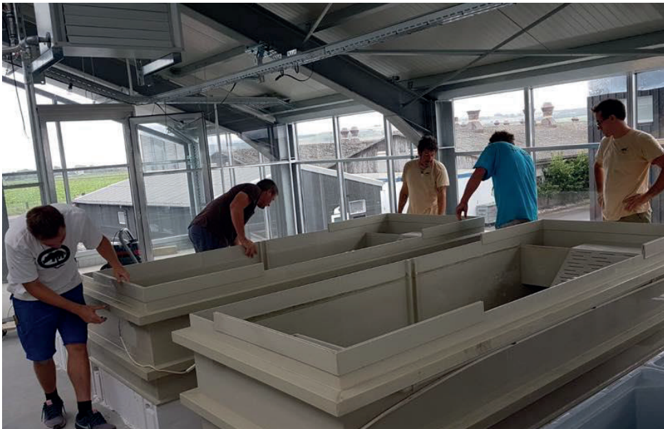
Die vielen Becken für exotische und seltene Schildkrötenarten werden im ersten Stock platziert.