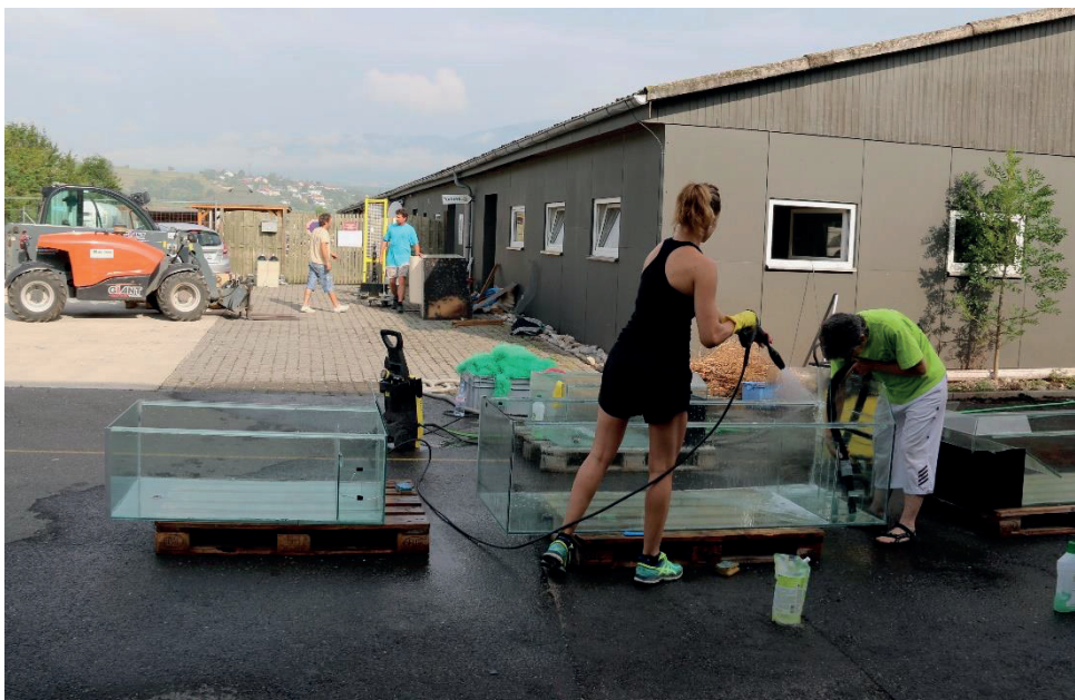
Die Aquarien werden draussen vor dem alten Zentrum bei heissen sommerlichen Temperaturen gereinigt.