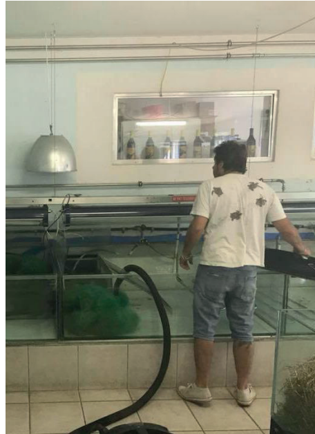
Alle Aquarien werden geleert und abmontiert.