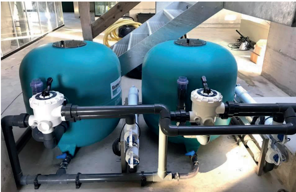
Eine vollautomatische Filteranlage sorgt für optimale Wasserqualität.