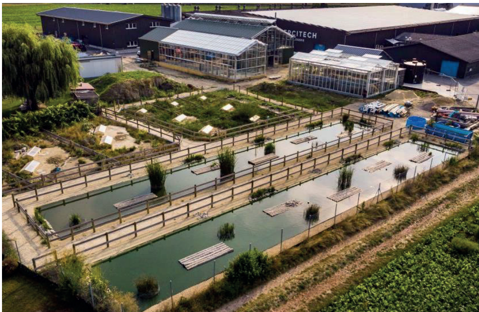
Das neue «Centre Emys» in Chavornay.