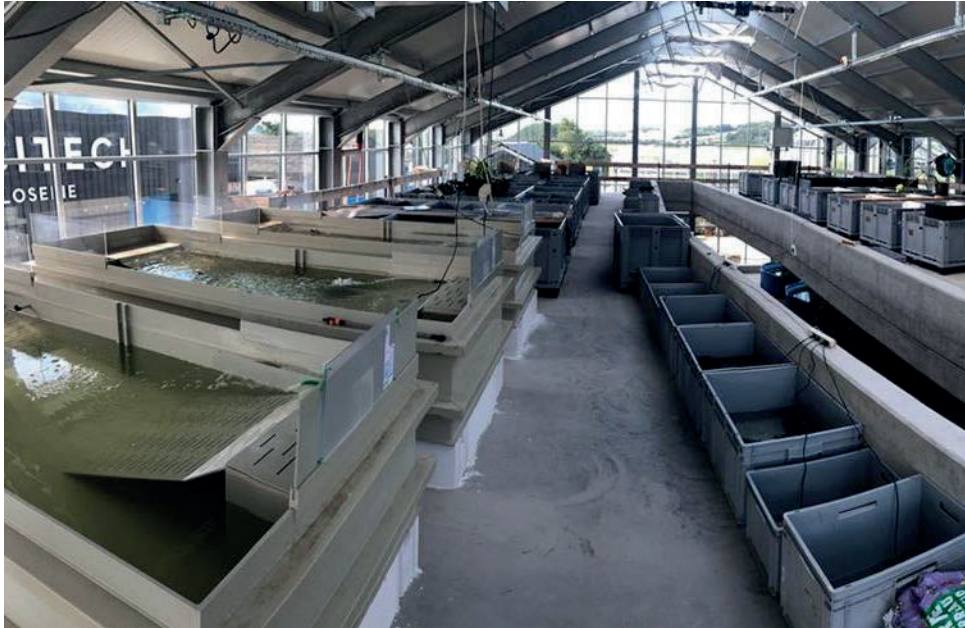
Die Becken werden mit Wasser oder Erde wieder gefüllt, bepflanzt und der Schildkrötenart entsprechend installiert.