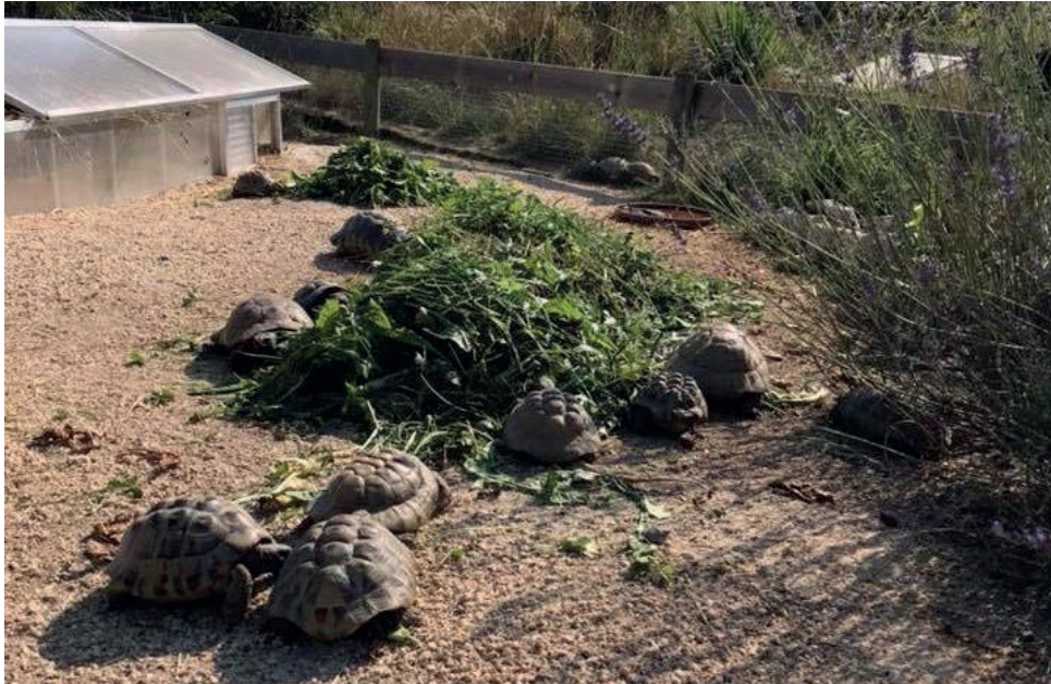
Viele hundert Land- und Wasserschildkröten besiedeln seit der Einweihung im Jahr 2017 die neuen Gehege und Teiche.