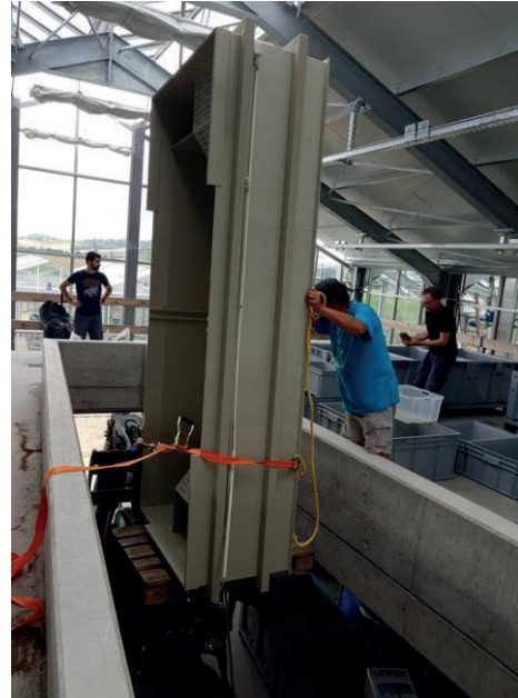
Anschließend wird alles fachmännisch ins neue Gebäude transportiert und montiert.