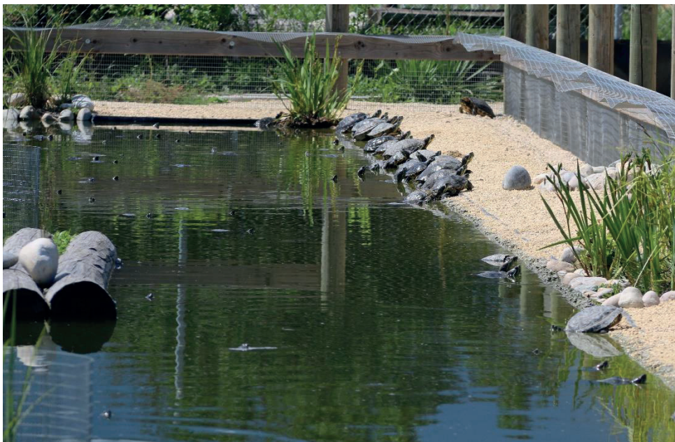
Die vielen Wasserschildkröten in einer der grossen Aussenanlagen.