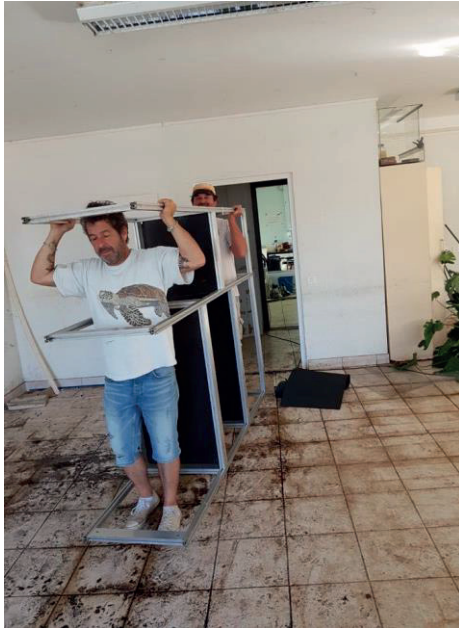
Sämtliches Inventar wird aus dem alten Zentrum ausgebaut.