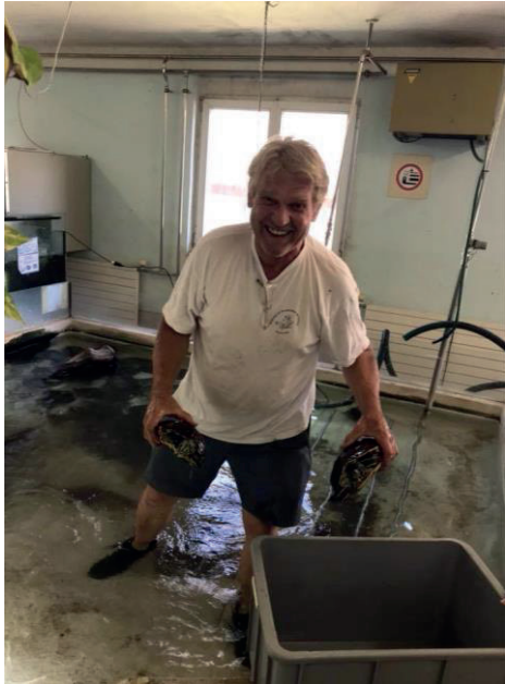
Fast 500 Schildkröten werden für den kurzen Transport vom alten Zentrum ins neue Gewächshaus in Behälter verpackt