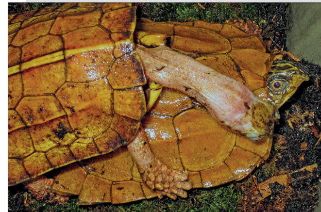
Abb. 6. Dieses Wildfang-Männchen produzierte mit einer 8 Jahre alten Nachzucht (nicht im Bild) etliche befruchtete Gelege. Interessanterweise hat keines der 18 bei der AZA registrierten Nachzucht-Männchen bisher für Nachwuchs gesorgt.