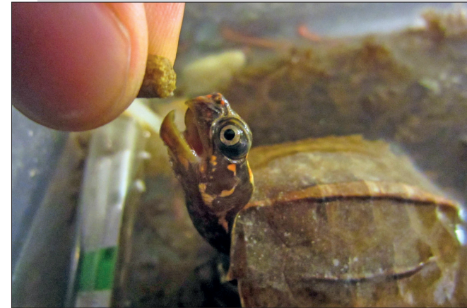
Abb. 5. With persistence, keepers may not only have their hatchling Geoemyda spengleri eating pellets, but doing so very eagerly.