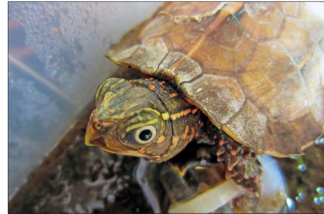
Abb. 4. Dasselbe Tier wie Abbildung 3, Nachzucht-Männchen sind ein schöner Erfolg.

Wir bei theTurtleRoom haben bei der Inkubation dieser Art Beobachtungen gemacht, die die Verwirrung komplett machen. Der AZA Species Survival Plan empfiehlt die Inkubation bei niedrigen Temperaturen, was Sinn macht. Wir haben drei Eier aus 2014 bei sehr niedrigen Temperaturen, zwischen 20°C und 23°C für den Großteil der Inkubationsperiode, mit sehr wenigen Spitzen bei 25°C inkubiert. Die Inkubation dauert 99, 99 und 111 Tage für diese drei Eier. Alle drei sind Weibchen geworden. Noch einmal, man müsste mit konstant gehaltenen Temperaturen testen, ob die Geschlechtsausprägung temperaturabhängig ist, aber wer würde das mit seinen Nachzuchten riskieren?