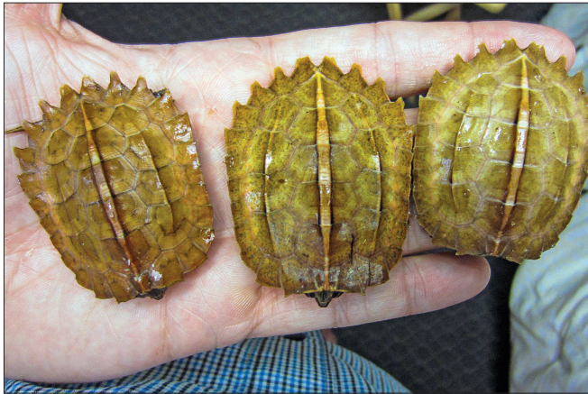
Abb. 2. Manche Geoemyda spengleri , wie diese 10 Monate alten Nachzucht Exemplare, können manchmal schon zeitig als Männchen identifiziert werden.