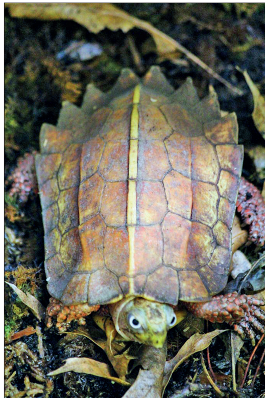
Abb. 1. Dieses Wildfang- Männchen (LTC) Geoemyda spengleri ist ein zuverlässiges Zucht-tier, selten in Gefangenschaftshaltungen.

mit eine gute Ausgangsposition für Geoemyda spengleri . Das Problem ist die unerfreulich niedrige Zahl an Männchen, die uns vor noch größere Herausforderungen stellt als Züchter, die mit anderen gefährdeten Arten arbeiten. Kombiniert man das mit einem bestenfalls verwirrenden Ansatz zur Geschlechterbestimmung, ist G. spengleri eine echte Herausforderung.