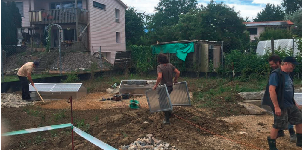
Freiwillige Helfer beim Gehege bauen und strukturieren für die europäischen Landschildkröten. Wegen dem ständigen Regen im Frühjahr kamen die Arbeiten nur zögernd voran.