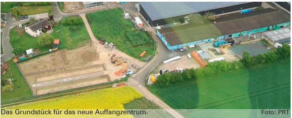
Das Grundstück für das neue Auffangzentrum.

Obwohl die notwendige Summe noch nicht erreicht ist, wurde der Dringlichkeit wegen trotzdem im Dezember 2015 mit dem Bau der Aussenanlagen und im November 2016 mit dem Betonbau für die Gewächshäuser begonnen.