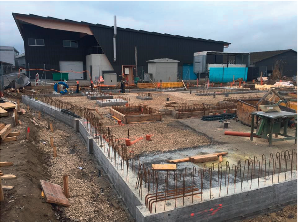
Die Umrisse des Gebäudes für die exotischen Schildkröten sind gut erkennbar.