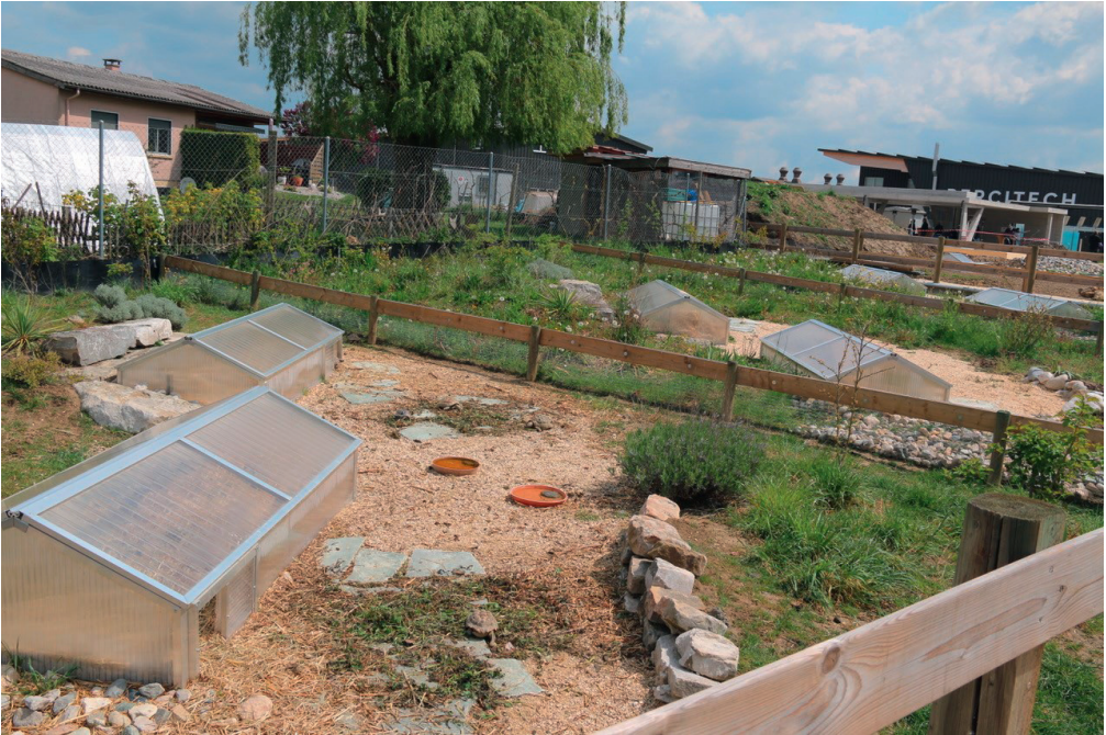
Anfangs September konnten die europäischen Landschildkröten in die grossen und artgerechten Anlagen einziehen.