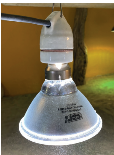
150 Watt Metaldampflampe

Beispiele für Lampen, welche sich als Grundbeleuchtung oder für den Wärmeplatz eignen, jedoch keine UV-Strahlung abgeben.