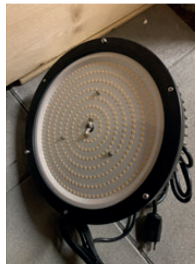
LED Strahler 150 Watt

Beispiele für Lampen, welche sich als Grundbeleuchtung oder für den Wärmeplatz eignen, jedoch keine UV-Strahlung abgeben.