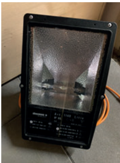
HQI Strahler 150 Watt