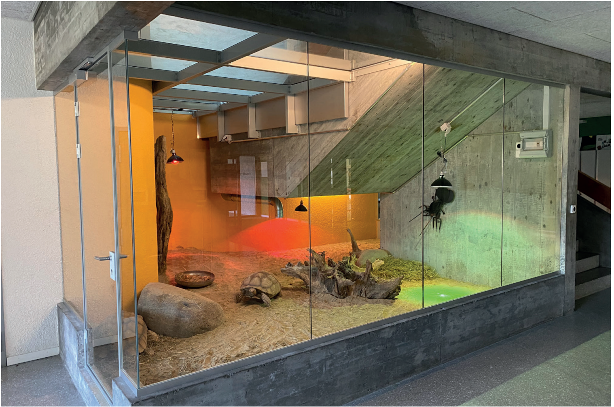
Die soweit fertige Anlage, rundherum mit Sicherheitsglas verglast, beheizt und beleuchtet.