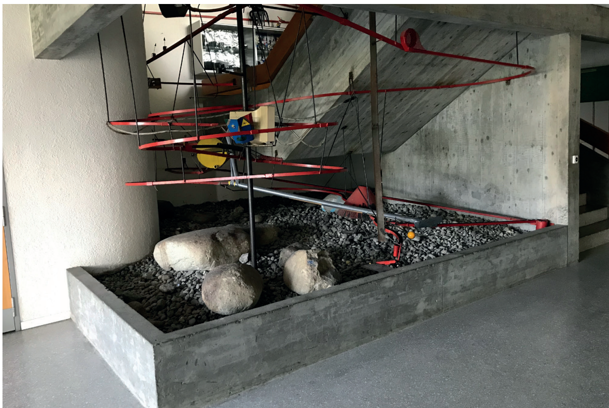
Hier soll die neue Innenanlage entstehen.

Abhilfe konnte geschaffen werden, indem man ein provisorisches Aussengehege auf dem Dach des benachbarten Schulhausgebäudes bauen konnte. Mit Hilfe des ortsansässigen Zimmermanns wurde in sehr kurzer Zeit eine artge-