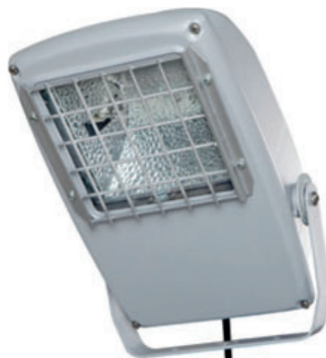
LIH UV Master Junior 150 skylight ECG (Zooversion)