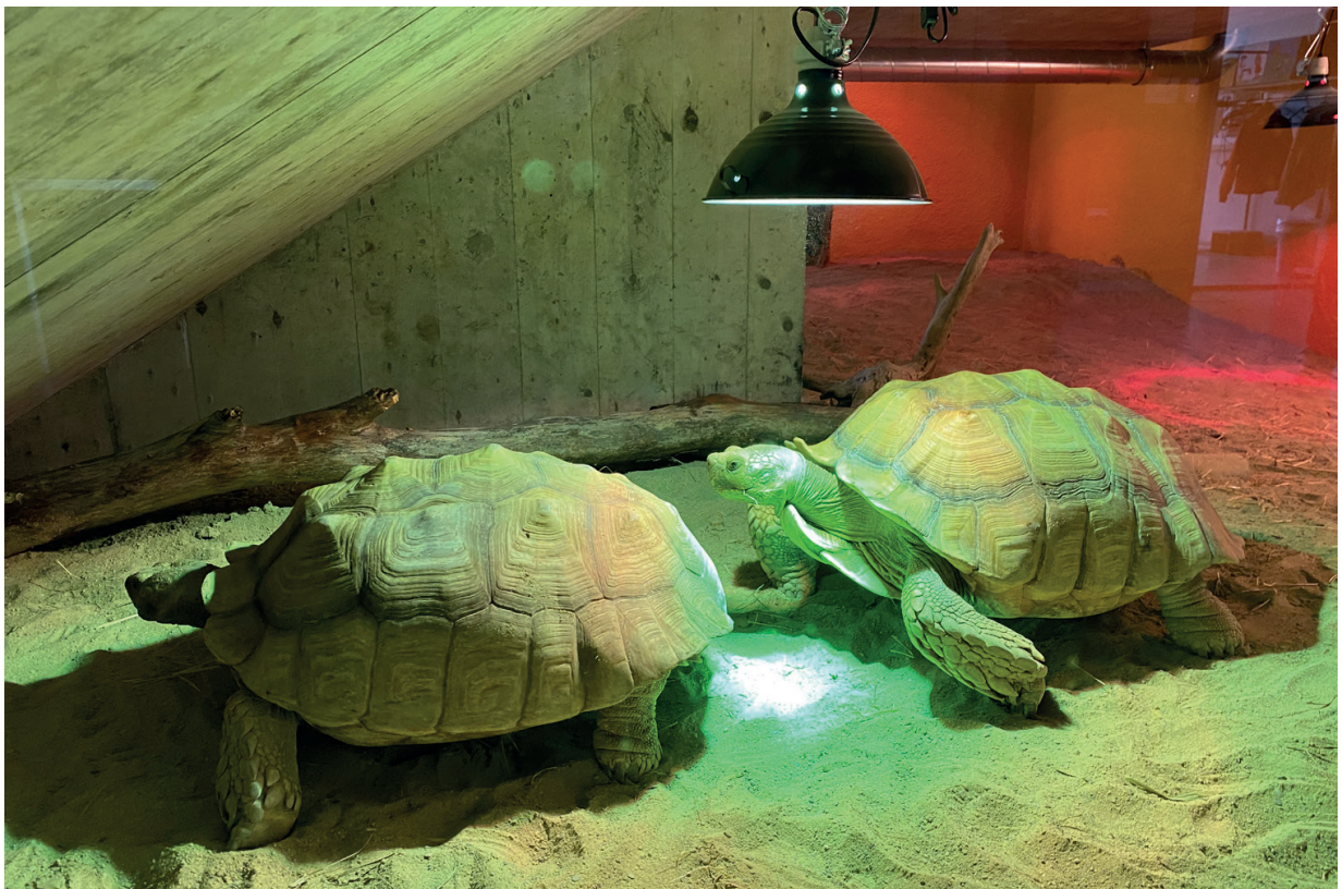
Besonnung mehrerer Tiere mit einer Lampe kann zu Schwierigkeiten führen.

Mit der Hilfe zusätzlicher Lampen konnte die Beleuchtung der Innenanlage und die Bestrahlung der Tiere verbessert werden. Zusätzlich zu den teilweise bestehenden Lampen wurden pro Sonnenplatz zwei zusätzliche 150 Watt starke UV-Metall dampflampen der „Zooversion“ verbaut. Diese mit elektronischen Vorschaltgeräten betriebenen Lampen erzeugen gleichzeitig naturnahe UV-Strahlung, konzentrierte Wärme und ein sehr helles Grundlicht. Die UVB-Strahlung ist wesentlich höher als bei UVB-Metall dampflampen mit geringerer Leistung (Watt). Auf den Bildern kann man den Unterschied zu den bestehenden Lampen gut erkennen und obwohl das Gehege nun gut ausgeleuchtet ist, erscheint der Rest der Fläche verhältnismässig dunkel. Es ist durchaus sinnvoll, alle technischen Hilfsmittel und vor allem die Beleuchtung zeitlich zu steuern. Die Idee