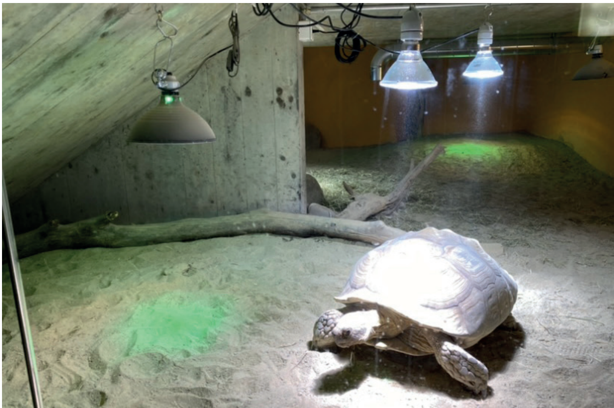
Durch den Einbau mehrerer Lampen, kann der ganze Körper einer grossen Schildkröte erwärmt werden.