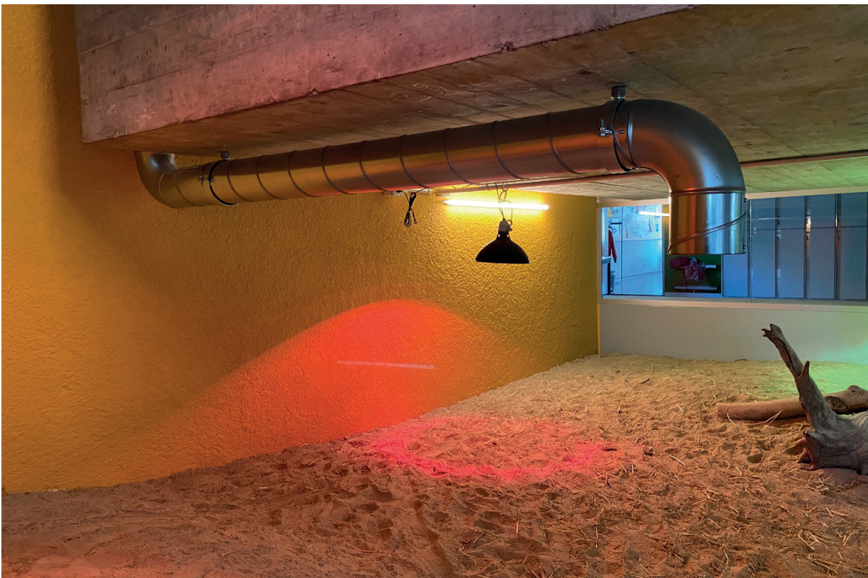
Lüftungsrohr für Frischluftzufuhr.