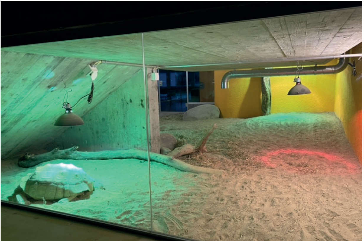
Beleuchtung der Innenanlage.