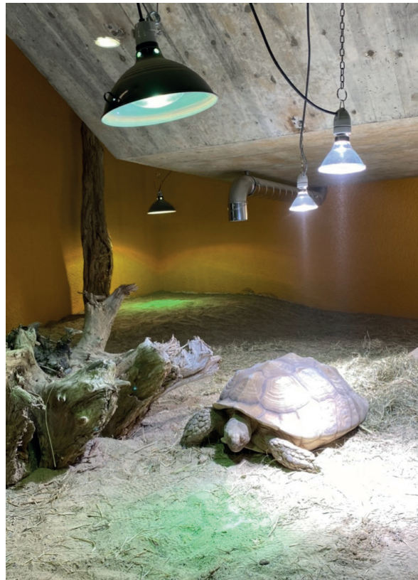
Lampen mit UV-Strahlung sind ein Muss.

In der beschriebenen Anlage, wird die Beleuchtung durch eine digitale Zeitschaltuhr gesteuert. Kurz nach dem Erlöschen sämtlicher Leuchtmittel sinkt die Temperatur und es ist nicht nötig, die Anlage nachts zu heizen. Am späten Morgen kommen die Tiere dann wieder hervor und wärmen sich an ihren Lieblingsplätzen auf, um auf Betriebstemperatur zu kommen.