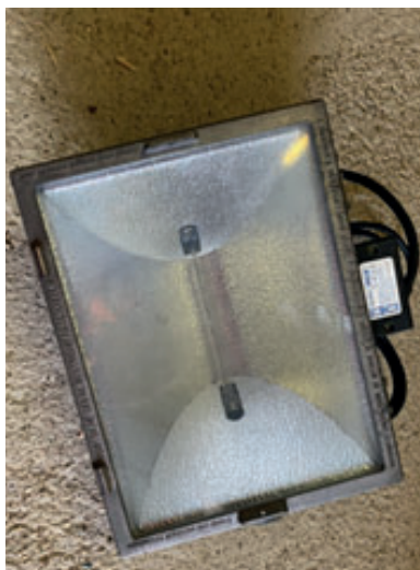
Halogenstrahler 1000 Watt