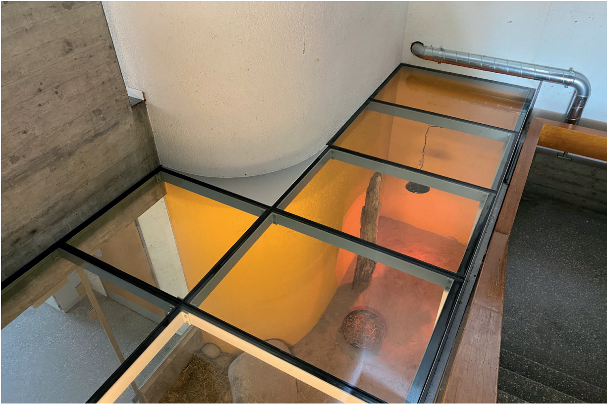
Abdeckung der Innenanlage.